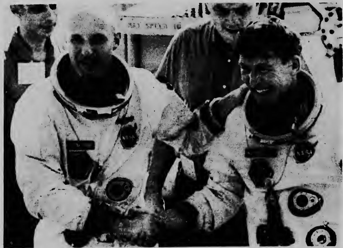
E astronautanan qu a viaha den e capsula Gemini-6, Tom Stafford y Wally Schirra, aki ta duna otro man den felicitacion mutuo despues qu nan a ser hisá a bordo di e portaaivion norteamericano Wasp, qu tabata sperando riba nan den Atlantico.

HOUSTON: Esaki ta un otro vista di e rendezvous entre Gemini-6 y Gemini-7 den espacio cu e astronautanan norteamericano Frank Borman y James Lovell den esun nave mas grandi riba e foto. Ya awe mainta nan tambe a baha normalmente den Atlantico.